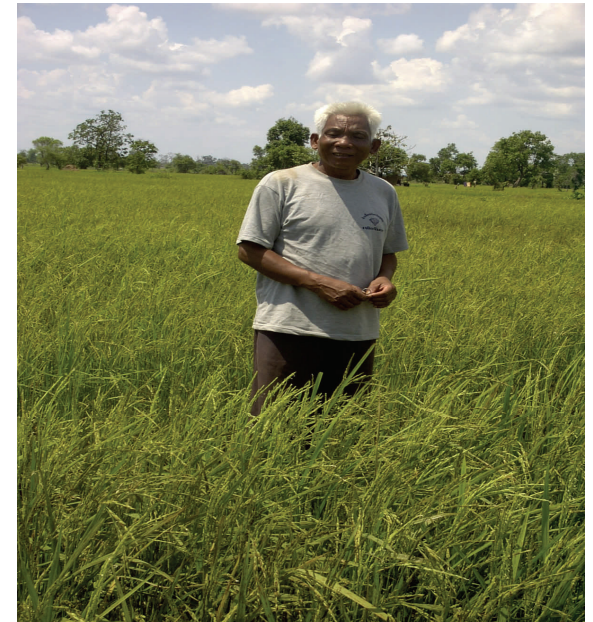
ເອກະສານ ປະກອບການຝຶກອົບຮົມ 16: